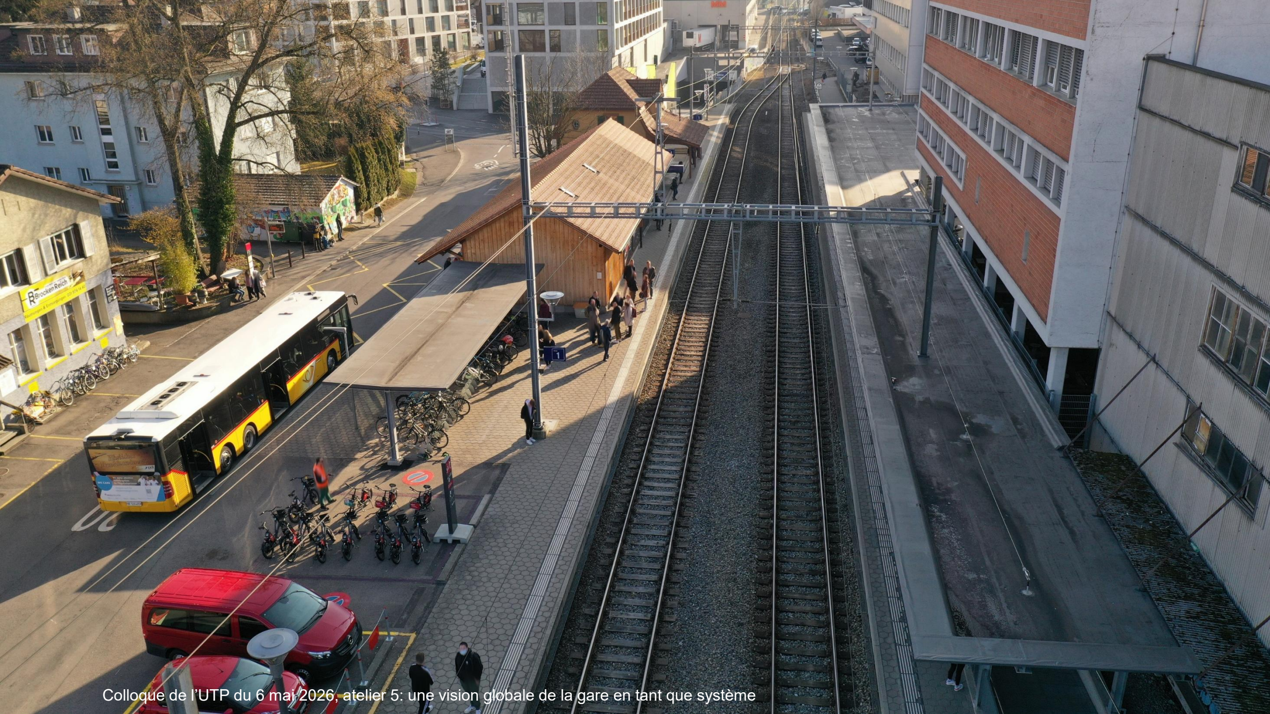
Colloque de l'UTP du 6 mai 2026, atelier 5: une vision globale de la gare en tant que système